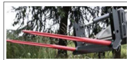
Balenvork LC30 (vorken met snelwissel-kader)