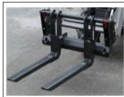
Palletvork TRC500 (vorken met snelwissel-kader)