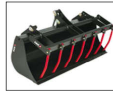
Multiservice bak 1,20 m