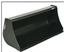
Bak 1,20 m

Voor frontladers in combinatie met cabine, frontlift of hydraulische aansluitingen vooraan, gelieve ons te contacteren voor een offerte op maat.