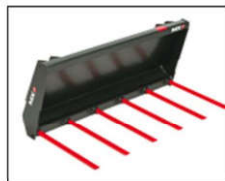
Mestvork 1,00 m